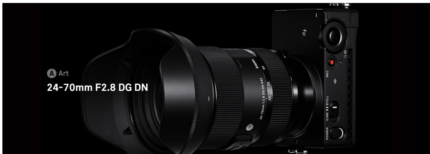
A Art 24-70mm F2.8 DG DN