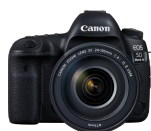
EOS 5D Mark IV