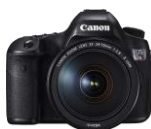
EOS 5DS R