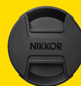
BOUCHON D'OBJECTIF LC-95B