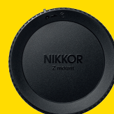
BOUCHON ARRIÈRE D'OBJECTIF LFN1