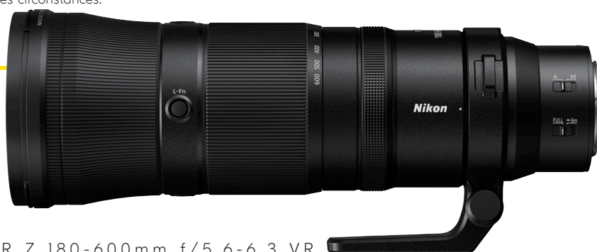
NIKKOR Z 180-600mm f/5.6-6.3 VR